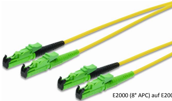
E2000 (8° APC) auf E2000 (8°APC)