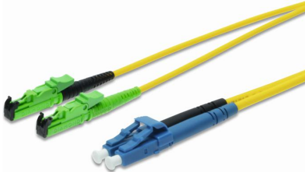
E2000 (8° APC) auf LC (PC)